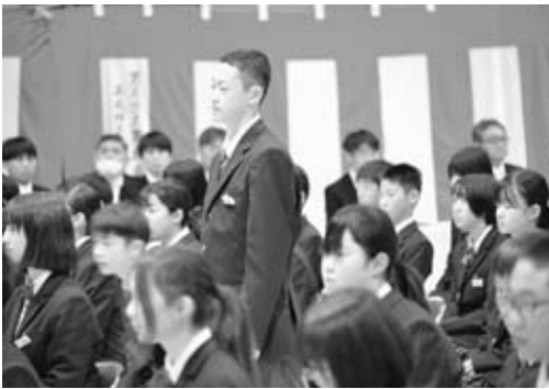
▲少し緊張した表情の新入生たち(男鹿東中)

今年度は市内小学校で101名が、中学校で113名が新一年生として学校生活をスタートさせました。