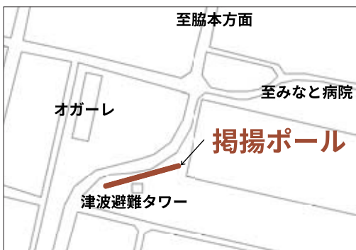
▲掲揚ポールはこちら

今年からは展示方法が変わり一斉に横並びとなるため、迫力ある光景が広がっています。5月中旬まで展示予定です。海と空を背景に泳ぐ大きなこいのぼりをぜひご覧ください。