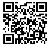
申請二次元コード