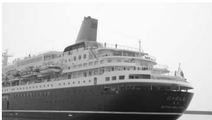
▲平成30年に寄港した際のにつぼん丸

※感染症の拡大状況などにより寄港中止となる場合は、市ホームページなどでお知らせします。