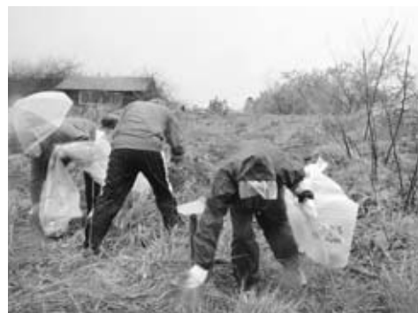
▲悪天候の中、多くの方が参加しました

ごみの運搬は、建設業者や町内会から提供を受けたトラックを使用し、全市で約27・99トンのごみが集まりました。