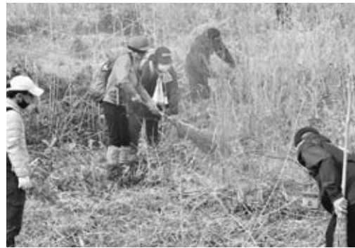
▲開始の合図で一斉に火入れを行いました

前日の雨や朝露の影響で、始めは着火に苦戦する場面もありましたが、風が出るなど好条件になったことで、予定していた面積約15ヘクタールのほとんどを焼くことができました。寒風山の景観を保つために毎年実施している山焼きを皆さまのご協力により、無事終えることができました。