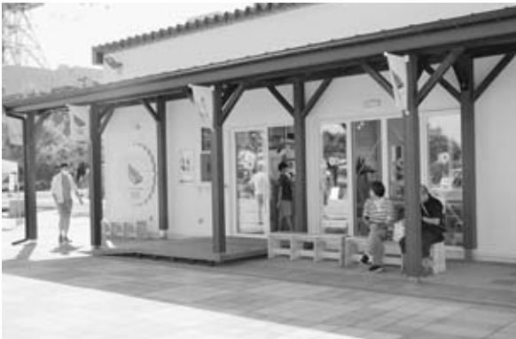
◀令和3年6月1日 わんぱく広場・大型複合遊具完成