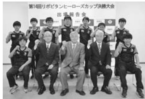
▲脇本おいばな船川くじらっこラグビースクールの皆さん