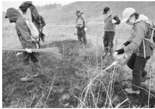
▲消化作業を行うボランティアの皆さん

寒風山の山焼きが、市内外からのボランティアをはじめ、地元自治会や消防団など約150人の参加を受け、4月23日に大噴火口内において行われました。 この山焼きは寒風山の草地環境と景観維持などを目的とし、毎年行っています。 当日は朝から時折小雨が降っていましたが、風下から着火して防火帯を作り、徐々に燃やす範囲を広げていきました。 雨の影響で、焼けた範囲は例年の7割程度でしたが、多くの皆さんのご協力のもと、今年も無事に終わることができました。