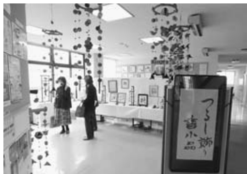
▲利用者の目を和ませた『つるし飾り・書小品展』