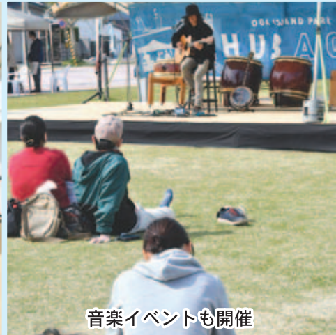
音楽イベントも開催