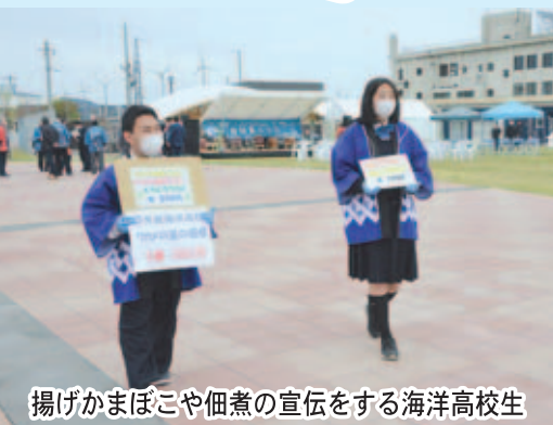
揚げかまぼこや佃煮の宣伝をする海洋高校生

ハブアゴー、叙勲、男鹿は未来、ワクチン、駅伝… P 2～7 5月臨時会、商品券、市長だより、HOTNEWS… P 8～13 地域おこし協力隊NEWS、SDGs通信…………… P 14～15 参議院選挙、日本海花火、ラジオ体操…………… P 16～18 くらし、ネウボラ、学び、Information…………… P 19～37