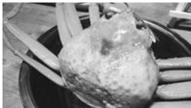
▲ご近所さんからいただいたカニ。サザエやハタハタ、ワカメ、タコなどももらいました。漁師町ならではのお裾分けですね。

いたこともありました。これは漁師町である男鹿ならではの考え方です。このお裾分けの考え方は今回のSDGsの考え方にも合っています。