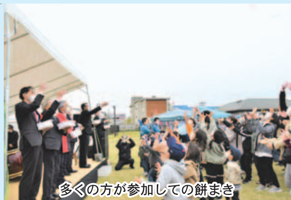
多くの方が参加しての餅まき