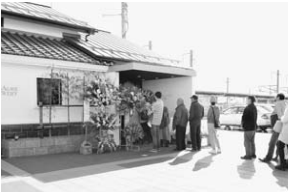
◀令和3年11月3日 旧男鹿駅舎を活用した醸造所(稲とアガベ)オープン