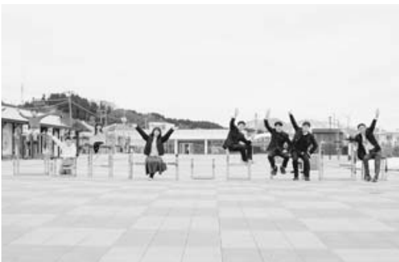
◀令和3年9月1日 市民駐車場オープン