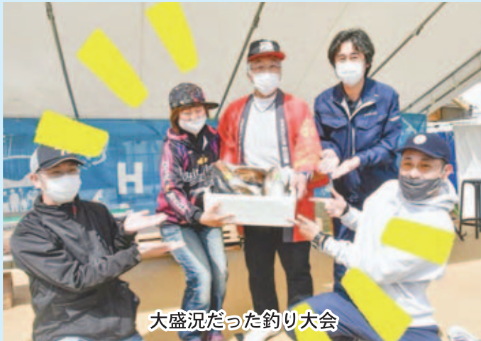
大盛況だった釣り大会