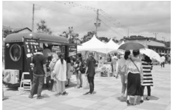
◀令和4年3月 モニユメント完成