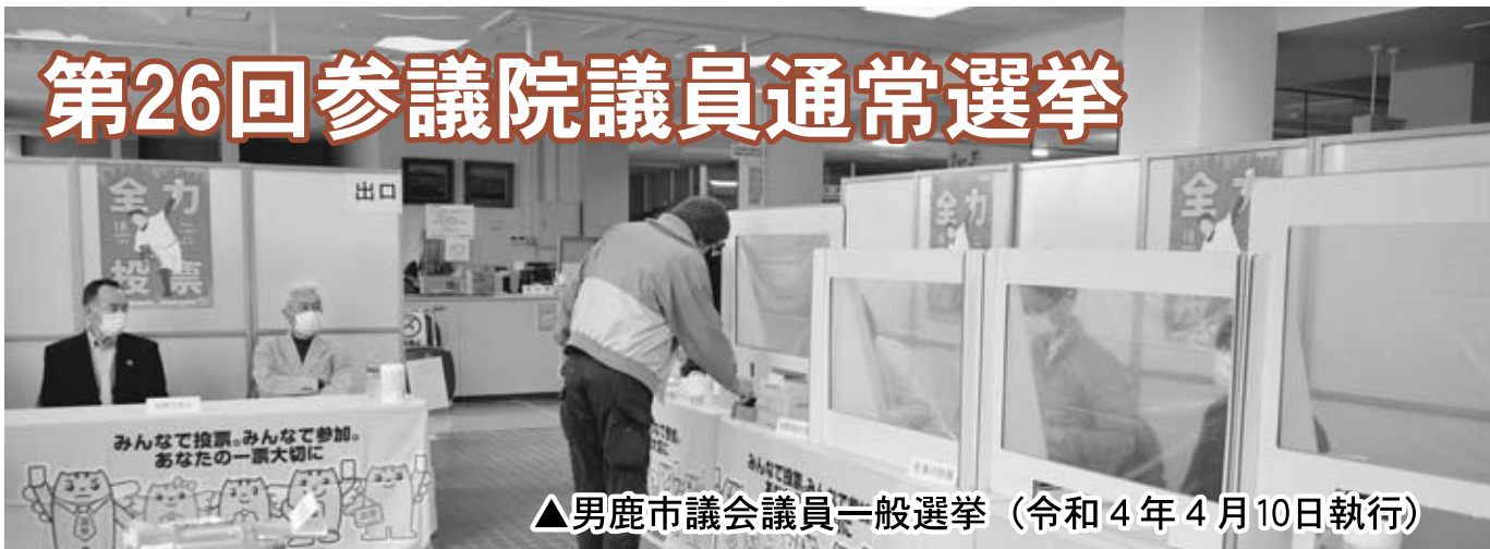
▲男鹿市議会議員一般選挙（令和4年4月10日執行）

今年の夏に第26回参議院議員通常選挙が実施されます。投票所では新型コロナウイルス感染症対策を行いますので、安心してお越しください。