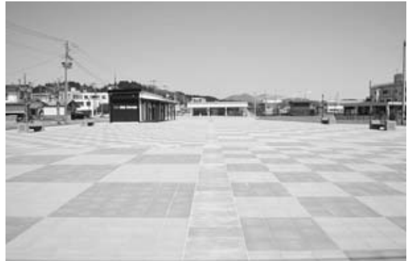
◀令和3年4月16日 チャレンジ広場オープン