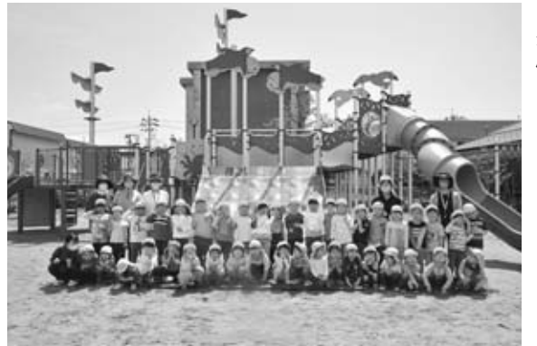
◀令和3年7月10日・11日 第1回ヤタイ市 開催