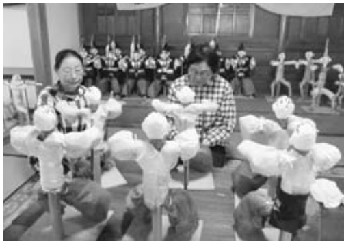
▲人形作りに励む会員