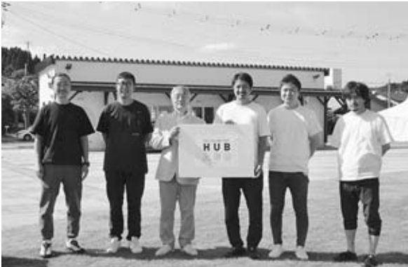
◀令和3年9月25日 男鹿駅周辺広場愛称決定&ホットドッグカフェオープン