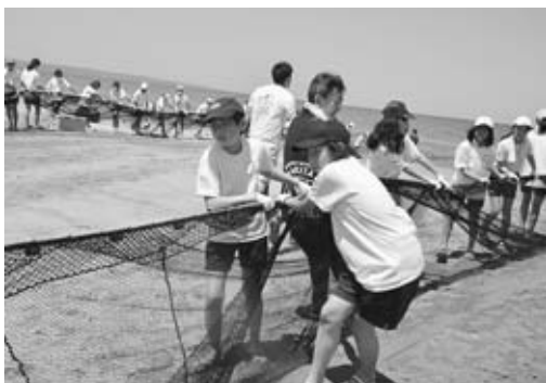
▲網が上がるまで、もう少し！

7月15日、五里合海水浴場で船川第一小学校の5・6年生54人が参加し、地びき網体験学習を行いました。当日は晴天に恵まれ、暑い中、5・6年生が力を合わせてロープを懸命に引き、引き上げた網にはコノシロ（コハダ）、シロギス、クロダイ、サヨリなどがかかりました。 昼食には、海の家で手作りの魚のつみれ汁がふるまわれ、汗をかけた体に染みわたりました。昼食後には水産振興センターの職員より、魚に関する講話が行われ、質問も活発に飛び交い、漁業や魚介類への理解を深めた一日となりました。