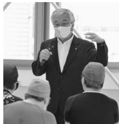
▲アクア健康教室であいさつする菅原市長