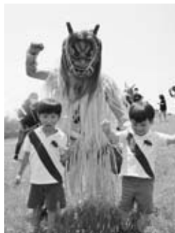
◀ ナマハゲと一緒にポーズをとる子ども