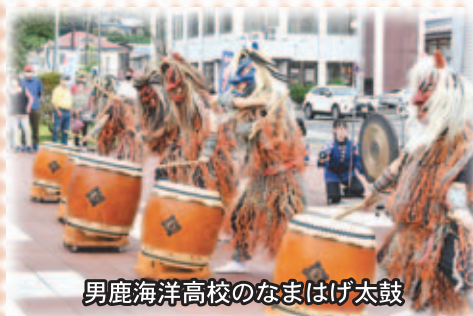
男鹿海洋高校のなまはげ太鼓