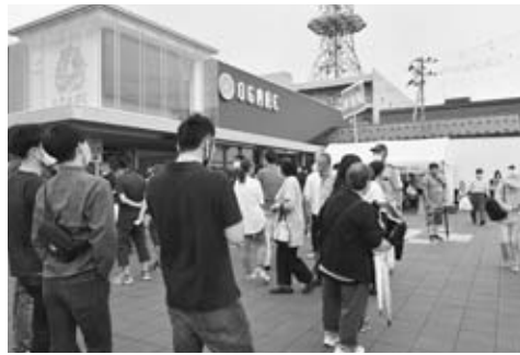
▲紅ズワイガニ販売会には多くの方が並びました

7月10日、11日、道の駅おが「オガイレ」と男鹿駅周辺広場を会場に33まつりと男鹿ヤタイ市が行われ、2日間で約6600人が来場しました。オガイレでは、紅ズワイガニやサザエの販売のほか、男鹿海洋高校郷土芸能部によるなまはげ太鼓などを実施しました。 また、ヤタイ市では、市内をはじめ県内各地から、飲食、手作り雑貨や工芸品、野菜販売などの屋台が並び、特に、メダカすくいの屋台は大人も夢中になるほどの人気で、誰もが真剣な様子で挑戦していました。