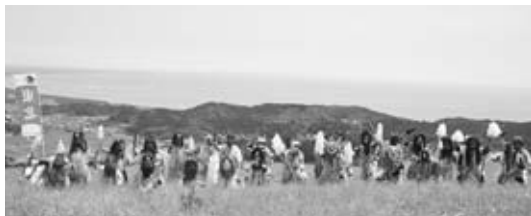
▶ 日本海を背景にして

6月26日、27日の2日間、「東北デスティネーションキャンペーン」の特別企画として寒風山で「男鹿のナマハゲ大集合！」が開催されました。両日とも天候に恵まれ、ご来場いただいた約1500人(2日間)の方々は、寒風山からの景観をバックにナマハゲとの写真撮影や、「恩荷」のなまはげ太鼓演奏を楽しむなど、ナマハゲの迫力に魅了されました。