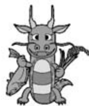
八郎湖水質保全 シンボルキャラクター 「清龍くん」