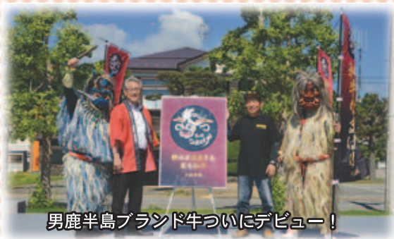
男鹿半島ブランド牛ついにデビュー！

新型コロナワクチン、なまはげ花火…P 2～3 第2回男鹿ヤタイ市、市長だより…P 4～5 地域おこし協力隊NEWS、HOTNEWS、中総体大会結果…P 6～9 集団検診、介護保険情報……………P 10～13 暮らし、ネウボラ、学び、Information…P 14～31