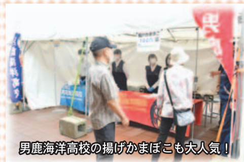
男鹿海洋高校の揚げかまぼこも大人気！