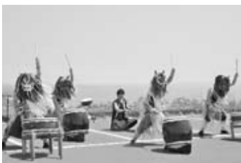
◀ 「恩荷」による迫力満点の和太鼓演奏