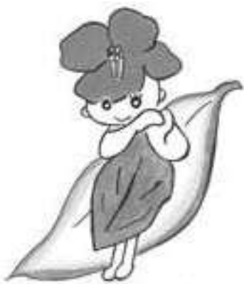
▲保健センターのマスコットキャラクター「つばきひめ」

男鹿椿会では、全国椿サミット開催に向け、市民のみならず、おもてなしする市民参加型のネットワークを広げるために、プロジェクトに参加して下さる市民の方々を募集しています。詳しくはお問い合わせください。