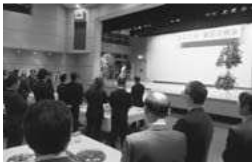
▲賀詞交換会には市内企業関係者など131名が出席しました

1月6日、市と市商工会の共催による賀詞交換会が市民文化会館を会場に開催されました。