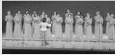
コールポート男鹿 (船川)

長年にわたる女性コーラスグループとして活動、市民に感動を与え数々の実績を重ねるなど、現在も幅広い音楽活動を続けており本市芸術文化振興に大きく貢献されました。