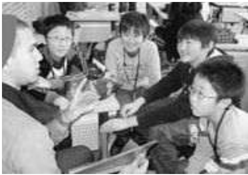
▲留学生とゲームなどを楽しむ児童たち