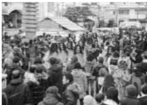
▲会場を練り歩くナマハゲ

たくさんの方々が集まった会場では、なまはげ太鼓の演奏に続き、ほら貝の合図とともに13匹のナマハゲが下山し「泣ぐ子はいねがー」などと叫びながら会場を練り歩きました。会場内は、ナマハゲのワラを拾う人や記念写真を撮る人などであふれ、最後は新年が良い年になるように願いを込めて、紅白の餅まきが行われました。