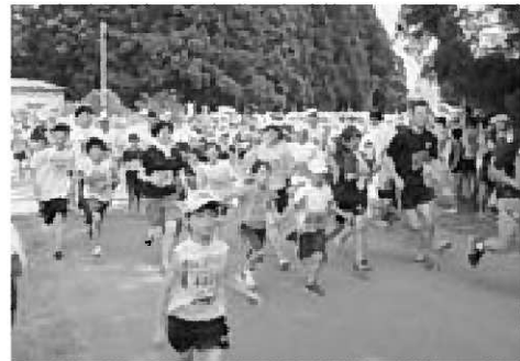
▲ ペアの部スタートの様子

レースを終えたランナーたちは、食べ放題の若美産メロンをほおぼり、疲れを癒していました。