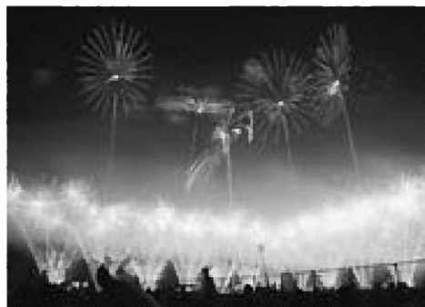
▲空想美術館の展示作品

また、メッセージ花火では普段お世話になっている方へ感謝の言葉や、来場した皆さんの前でプロポーズをするなど、男鹿日本海花火ならではの光景が広がっていました。