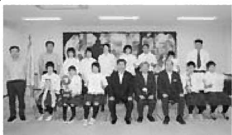
▲県大会での結果報告と東北大会での健闘を誓った男鹿東中バスケット部と柔道部の選手ら

また柔道部は、東北大会にすすんだ女子団体が3位、個人戦で東北大会や全国大会にすすんだ選手らも3位に残るなど健闘しました。