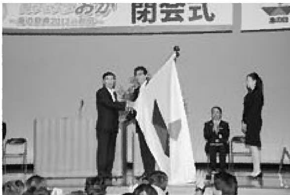
▲海フェスタフラッグの引き継ぎを行う多々見舞鶴市長と渡部市長

式では、渡部市長が開催地を代表してあいさつし、次期開催地（京都府舞鶴市を中心とした5市2町）代表の多々見良三舞鶴市長に海フェスタフラッグを引き継ぎました。