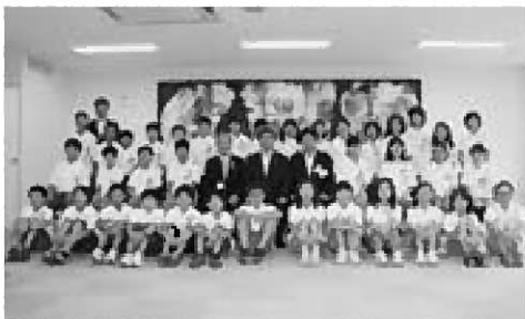
▲ 春日井市の児童には記念になまはげの人形が贈られました