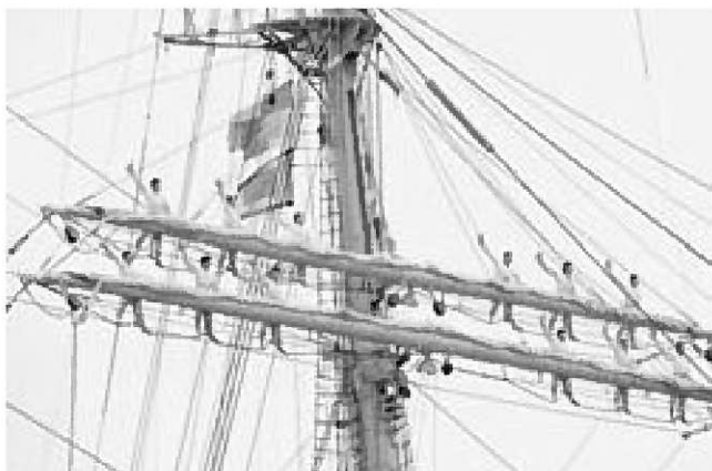
▲海王丸の登檣礼(とうしょうれい)

また同時期には、3000m級の深海調査を行う無人探査機「ハイパードルフィン」を搭載した海洋調査船「なつしま」も船川港に入港しにぎわいをみせていました。