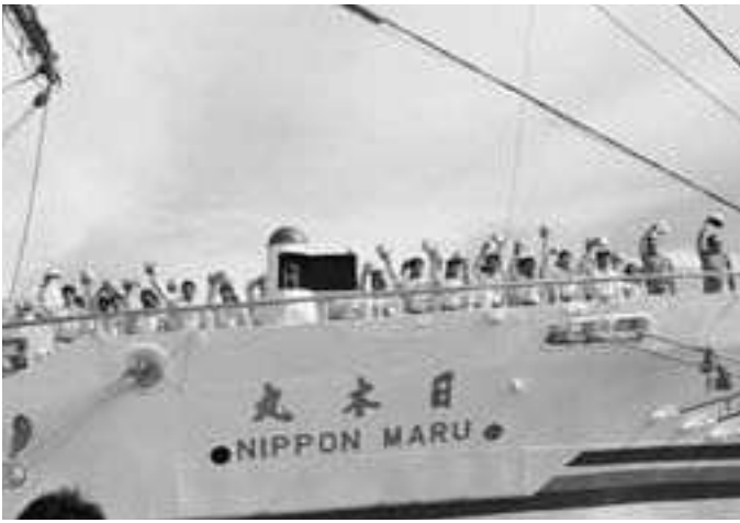
▲雨のため中止となった「登しょう礼」に代わり行われた日本丸の「登げん礼」(22日)