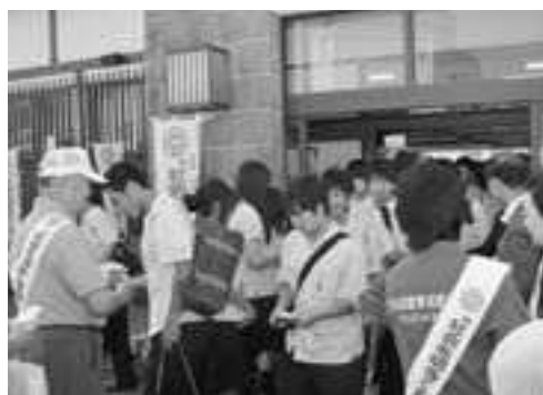
▲男鹿駅の乗降客に呼びかけを行いました

これは毎年7月に行われているもので、犯罪や非行の防止と罪を犯した人たちの更生について理解を深め、それぞれの立場で犯罪のない地域社会を築こうとする全国的な運動です。この機会に自分には何ができるか、皆さんで考えてみませんか。