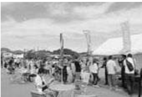
▲出発地の悪天候により展示飛行が中止になるも、ブルーインパルスパイロットのサイン会に並ぶたくさんの皆さん (13日)