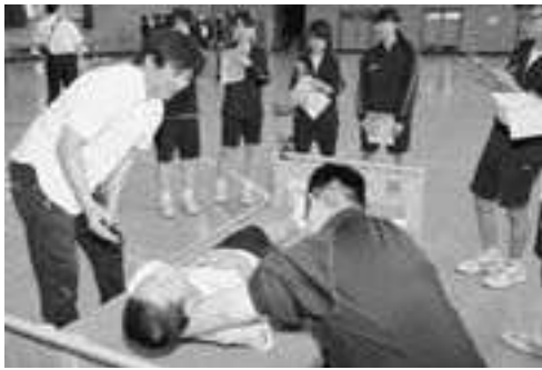
▲仰臥位（ぎょうがい＝仰向けに寝た状態）からの「起き上がり」を学ぶ生徒たち