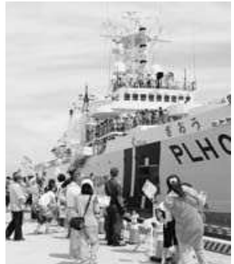
▲巡視船ぞうの体験航海 (15日)