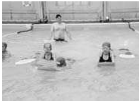
▲泳ぎ方を教わる児童たち

この教室は小学生の体力向上を推進するため、6年生までに50メートルを泳ぐことを目指しているもので、参加した児童らは、日本体育協会認定の水泳指導員や元国体選手などから、水に慣れることやビート板を使った泳ぎ方の基本などを教わっていました。