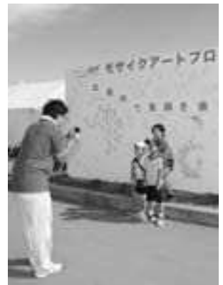
▲会場の笑顔の写真でモザイクアートを作成 (20日)