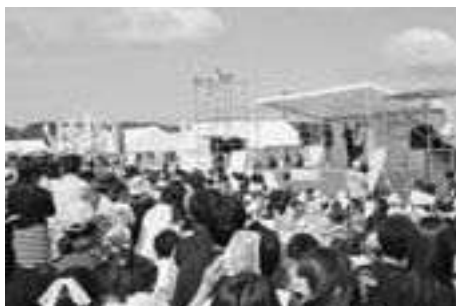
▲たくさんの人が集った爆笑ライブ (20日)