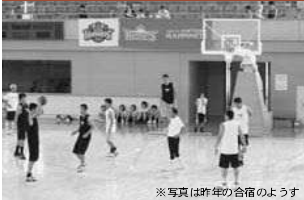
※写真は昨年の合宿のようす

秋田ノーザンハピネッツが今年も本市で合宿を行います。公開練習はどなたでもご覧いただけます。