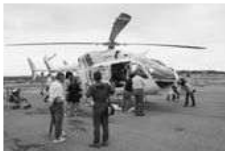
▶DMAT訓練のため飛来したドクターヘリ(14日)