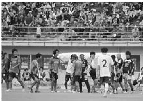
▲ゴールを喜ぶ選手と監督らスタッフの皆さん