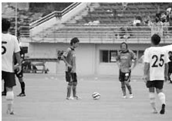
▲フリーキックで攻め込むブラウブリッツ秋田の選手たち