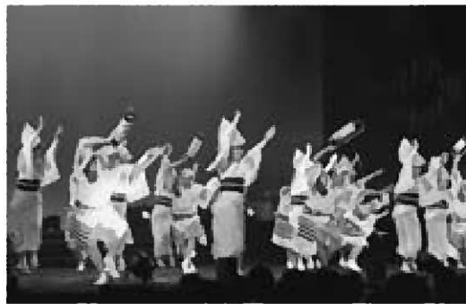
▲四国三大祭りに数えられる「徳島阿波踊り」

これは、10月1日から行われていた「デュステイネーション」キャンペーンに合わせ、市やJTB東北などで構成する実行委員会が主催して開いたもので、観光ツアーなどの参加者が県内外の伝統芸能を鑑賞しました。屋外では「竿燈」や「綴子(つづれこ) 大太鼓」が参加者を出迎えたほか、ステージでは、なまはげ太鼓や「北前船」で各地に伝わったとされる伝統芸能などが披露されました。