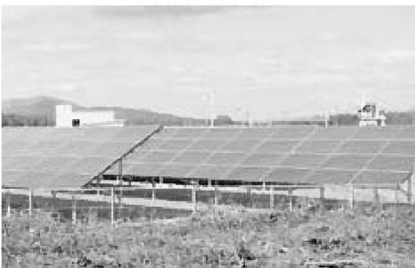
▲4620枚の太陽電池が並ぶ発電所、左奥に見えるのが管理棟