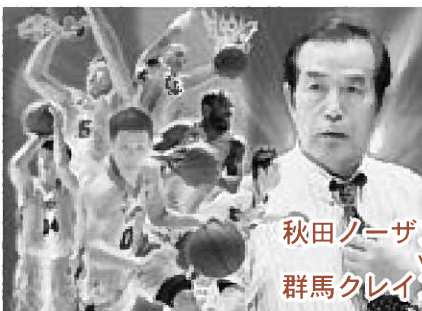
秋田ノーザンハピネッツ vs 群馬クレインサンダース