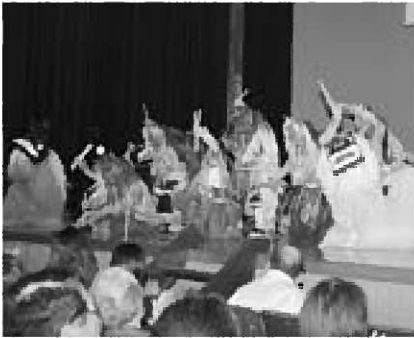
▲なまはげ太鼓と獅子舞の競演

10月13日、本市を拠点に活動する和太鼓団体「男鹿っ鼓(こ)」が主催するライブ「男鹿っ鼓の宴」が、市民文化会館で開催されました。