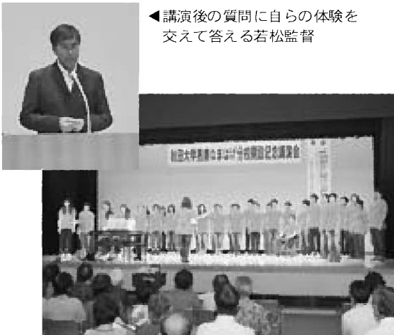
◀講演後の質問に自らの体験を交えて答える若松監督