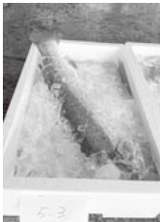
▲特大サイズのサーモン

今年も、男鹿の清らかな海で大規模な水揚げが実現しました。今年も水揚げが順調で、大ぶりのサーモンもたくさんありました。今年も水揚げが順調で、大ぶりのサーモンもたくさんありました。 今年も水揚げが順調で、大ぶりのサーモンもたくさんありました。