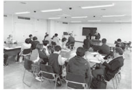
▲高齢者自立支援推進協議会の様子

バス運転手・タクシー運転手だけではなく、全ての観光関係者・全ての市民が接遇について心がけなければなりません。まずは、尚一層、「明るいあいさつ運動」に取り組みます。「男鹿は、景色よし・食よし・ナマハゲよし、しかし一番いいのは接遇だ！」と言われるように頑張りましよう。旅人が旅先で一番印象に残るのは、その土地の人との会話です。観光は、「幸せづくり産業」です。