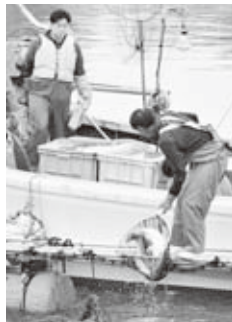
▲男鹿つばきサーモン水揚げの様子