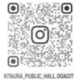
KITASU PUBLIC HALL LOGO CITY