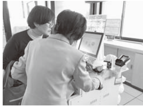
▲スマホで初めてのキャッシュレス決済に挑戦！

毎月各コミセン・公民館で開催しているスマホ教室の参加者から「スマホでキャッシュレス決済を体験したい！」との声があり、市内の飲食店など3店舗で体験会を行いました。当日は7名が参加し、店舗での実践を通じてスマホ決済を体験しました。「教えてくれる人がいるから安心して挑戦できた」との声のほか、「小銭いらすずで楽」「意外と簡単」「一人で出来そう」など好評をいただきました。一方で、「二度では分からない」という意見もあり、今後も継続して開催していきたいと考えています。 ぜひ「楽しく学べるスマホ教室」にご参加ください。