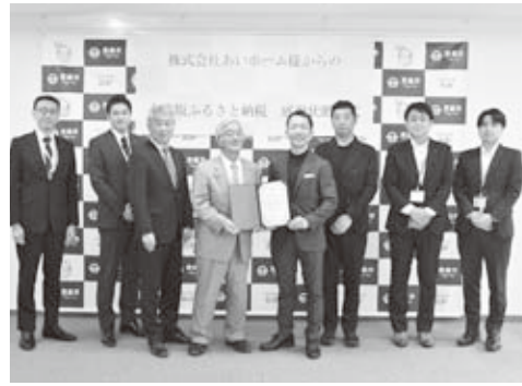
▲感謝状贈呈式の様子

株式会社あいホーム様の企業版ふるさと納税感謝状贈呈式が4月20日に行われました。同社は宮城県豊富市に本社を置き、住宅の建築・販売等を手掛ける企業です。 現在、男鹿市では大型ショッピングモール開業、ホテルやアーデーターンターなどの企業進出など、まちの変化が進む一方で、宅地や若者のニーズに合った住宅の不足が課題となっています。今回のご寄附を大切に活用させていただくとともに、今後はいろいろな分野においても同社と連携し、活力あるまちづくりに取り組んでいきたいと考えています。