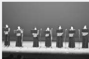
オカリナ風雅 (船川)

平成19年の結成以来、演奏技術を磨き、男鹿市民文化祭、芸文フェスティバルおが、オカリナ音楽祭へ出演するほか、福祉施設の慰問等、地域社会に貢献する活動を続け、本市芸術文化の振興に大きく貢献しました。