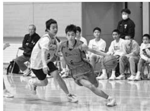
▲奮闘する地元・男鹿東中学校

12月28日から30日までの3日間、男鹿市総合体育館・若美総合体育館において、全国から集まった18チームが熱戦を繰り広げました。