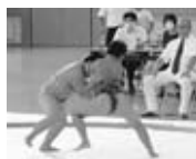
▲市民スポーツ祭相撲競技より