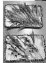
◀お披露目されたクルマエビ