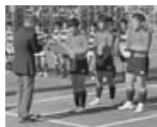
▲東日本中学校ラグビー大会