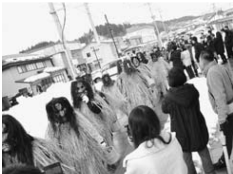
▲男鹿駅周辺を練り歩くナマハゲ

男鹿駅周辺広場では、男鹿和太鼓愛好会によるなまはげ太鼓の演奏や餅撒きが行われ、会場は約1000人もの人でにぎわいました。