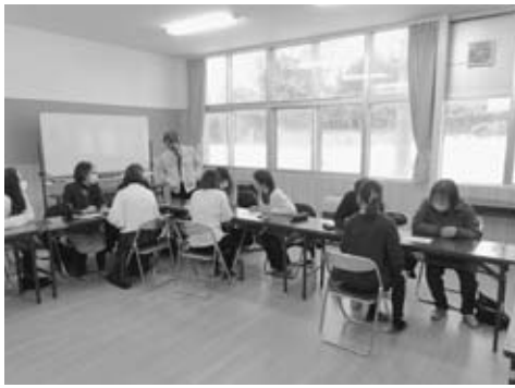
▲各班に分かれて相談中の模様

12月19日、五里合コミュニティセンターで、スマートフォン操作を学ぶ「スマホ教室」が開催されました。LINEの登録・利用や二次元コードの読み取り方法、ネット検索の仕方など、参加者は一つ一つメモを取りながら受講しました。一回では覚えきれず、分かるまで何回も挑戦してできた時の笑顔に、こちらまで嬉しくなりました。 受講後、参加者から「大変勉強になりました。ありがとうございます。今日来て良かった。また開催してね」と温かい言葉をいただきました。 (五里合コミュニティセンター所長 川崎耕一)