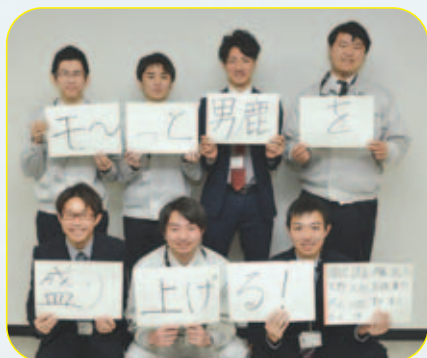
市役所職員（平成9年生まれ）