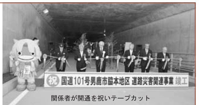
関係者が開通を祝いテープカット

式では菅原市長が「市民が待ちに待った工事が完了した。今後はソフト面を充実させ、希望をもって男鹿に来て、幸せな気持ちで帰ってもらえるよう頑張りたい」と話しました。