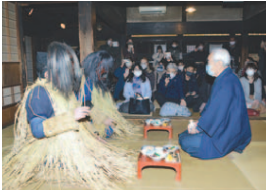
▲ナマハゲ行事を体験する参加者

12月6日、なまはげ館や真山伝承館などを会場に第18回ナマハゲ伝導士認定試験が行われ、県内外から57人が受験しました。 なまはげ館では行事の説明が行われ、真山伝承館では実際の行事を体験し、ナマハゲと家の主人の間答に熱心に見入っている様子でした。その後、会場をセイコーグランドホテルに移して講義が行われ、ナマハゲの歴史や継承状況などを学び、最後に筆記試験を行いました。その結果、新たに認定された伝導士を含め、全国の伝導士は1476人となりました。