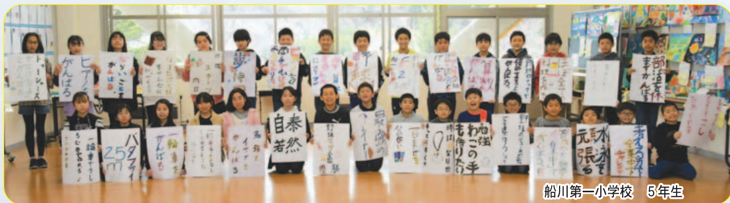
船川第一小学校 5年生