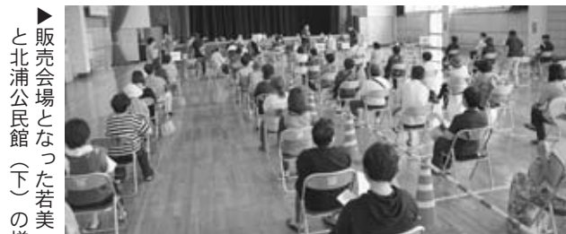
▶販売会場となった若美コミュニティセンター（上）と北浦公民館（下）の様子

引き続き、市商工会にて販売していますので、ご活用ください。（販売時間／平日10時～15時）