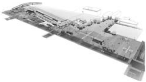
男鹿駅周辺整備後のイメージ

市民の皆さんが「自分たちの広場」として、愛着をもって使っていただけるような広場にしていきたいです。