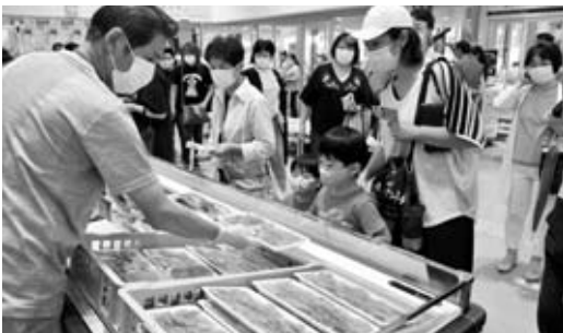
▲エビ・イカ・サザエの特売

また、道の駅間交流による物品も多数出品され、「道の駅十文字」のサクランボや「道の駅ぎのぎ」の沖縄県産スナックパンなどが棚を彩りました。11日には1日限定で「道の駅うご」のブースが設けられ、名物の冷やがけそばやスイカなどの物産品販売が行われました。両日ともあいにくの雨模様でしたが、店内は多くの人でにぎわっていました。