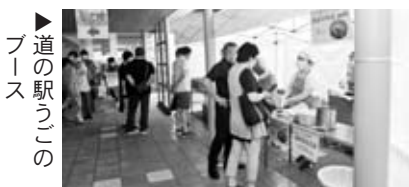
▶道の駅うごの ブース