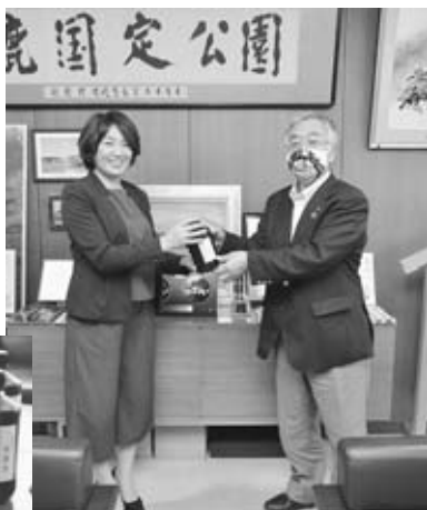
(市民の方からいただいた手作り「なまはげマスク」)