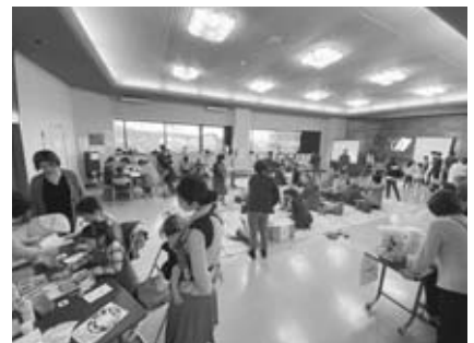
▲子ども×地域 元気アップひろば