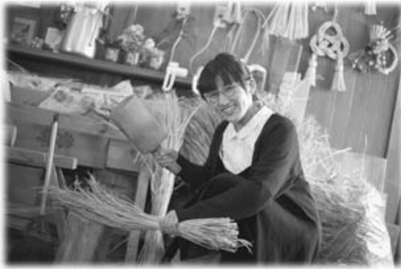
真山・里暮らし体験塾で行ったシベとり

また来たい！」と言ってもらえたことや、男鹿に来たことがない人から「楽しそう、行ってみたい」という声を聞かせてもらえたことが私の活動の励みになっていました。 1年目の活動を通して感じたことは、地域を知ることと同じように、外に向けた発信が大切だということです。外からは見えづらい地域の魅力を、目に見える形で伝えることの難しさを実感しました。