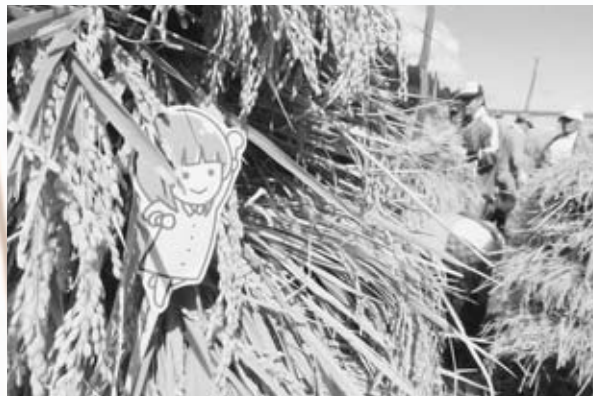
安全寺地区で行った稲刈り

私の貴重な時間になっています。 男鹿の自然やおいしい食べ物、人の温かさに支えられ、私は今日まで男鹿にいらることができました。誰も予想していなかったことが起こりうる時代に、地域をつくる方々に支えられて、日々を送ることができています。まだまだ力不足ではありますが、「協力隊になって、男鹿に来てよかった！」と、胸を張って言える自分であるために、常に外に目を向けておくことを忘れずに日々精進していきます。これからも、よろしくお願ひします。