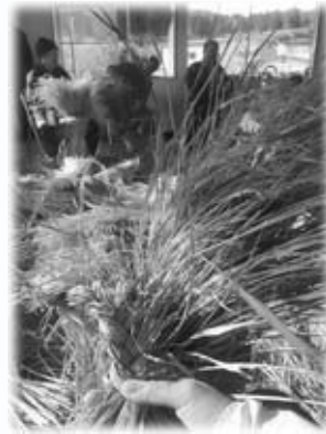
安全寺地区で行ったケデあみ

2年目の活動では、男鹿にある伝統、文化、豊富な資源、自然、この土地で暮らす人の日常を、1人でも多くの人に伝えていきたいです。離れている人にも男鹿のことを身近に感じてもらえるような情報の発信や、きっかけをつくっていききたいと考えています。