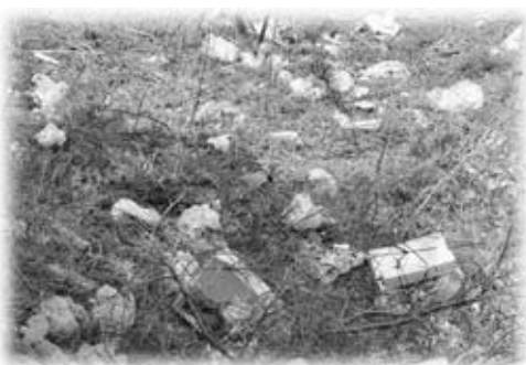
▲心無い人の不法投棄があとを絶ちません

ポイ捨てを含め、不法投棄は犯罪です。1000万円以下の罰金刑または5年以下の懲役刑が科されるおそれがあります。絶対に不法投棄をしないようにお願いします。