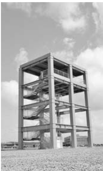
▶完成した津波避難タワー

名称：船川港津波避難タワー 所在地：男鹿市船川港船川字外ヶ沢地内 （道の駅おがオガレ向かい） 収容計画人数：84人 高さ：約11メートル（避難階高さ）