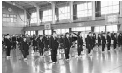
▲潟西中では全員がマスク姿で出席