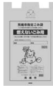
燃えないごみ袋（青）