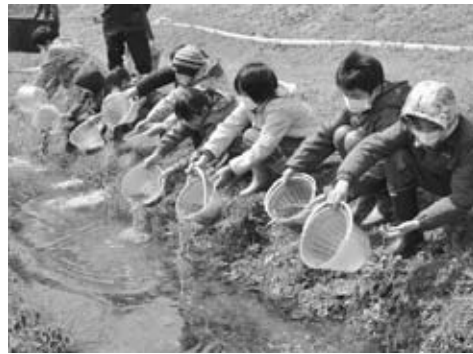
▲4・5年生全員で一斉に稚魚を放流

4月10日、北陽小学校の4・5年生9人が、北浦・野村川へサケの稚魚約2万尾を放流しました。 放流体験は、北陽小児童を対象に、サケの生態と漁業の関わりを学んでもらうため、県漁協野村川さけふ化場と県水産振興センターの協力のもと毎年実施しています。 放流したのは、同ふ化場が採卵し、全長約6センチ・1ヶ月にふ化させた稚魚で、児童たちは「頑張って帰ってきてね」と声をかけながら一斉に放流し、勢いよく泳いでいく稚魚を見送りました。