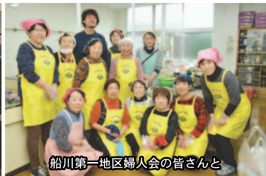
船川第一地区婦人会の皆さんと