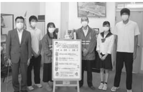
▲寄贈する男鹿工業高校生と男鹿署員、男鹿地区少年保護育成委員の皆さん