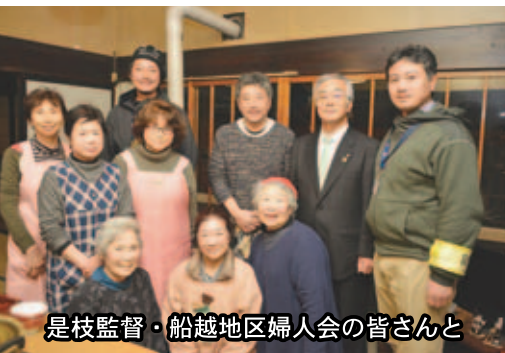
是枝監督・船越地区婦人会の皆さんと

それから2年の月日が流 れ、たすくは東京にいた。 ことねには愛想をつかさ れ、地元にも到底いられず、逃 げるように上京したものの、 そこにも居場所は見つか らず、くすぶった生活を送 っていた。そんな矢先、親友 の志波からことねの近況を 聞く。ことねと娘への強い 想いを再認識したたすくは、 ようやく自らの愚行と向き 合い、地元に戻る決意をす る。だが、現実はその容易 いものではなかった……。 果たしてたすくは、自分の 『生きる道』、『居場所』を見 つけることができるのか？