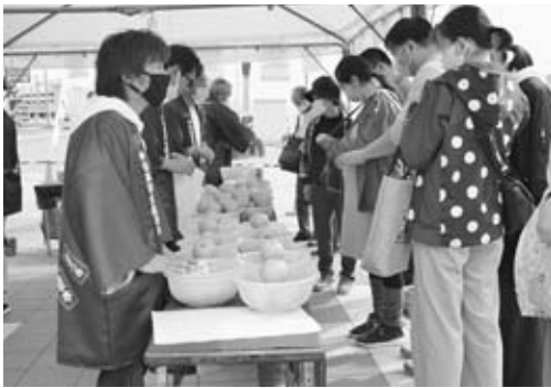
▲ざる売りの豊水を買求める来場者

オガール内では、男鹿梨のフルーツ酢やドレッシングなどが販売されたほか、直売所横ではなまはげ太鼓が披露され、秋晴れの下、多くの家族連れでにぎわいました。