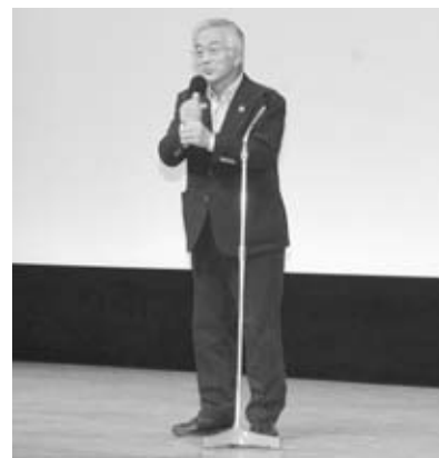
▲映画「泣く子はいねえが」の試写会であいさつする菅原市長