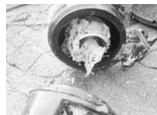
マンホールポンプに詰まった紙おむつやタオルなど