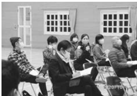
▲活発な意見交換となった北陽小

意見交換会に参加した保護者や地域住民からは、「距離が長くなり通学時間が心配」「部活動は現在合同チームだが、学校統合でどうなるのか」「児童クラブを地域の拠点として考えてもらいたい」「地域との交流を続けてほしい」などの意見がありました。市では保護者や地域住民からのご意見を踏まえ、計画案の策定を進めてまいります。