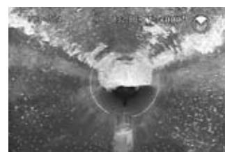
下水道管に固着した油脂類