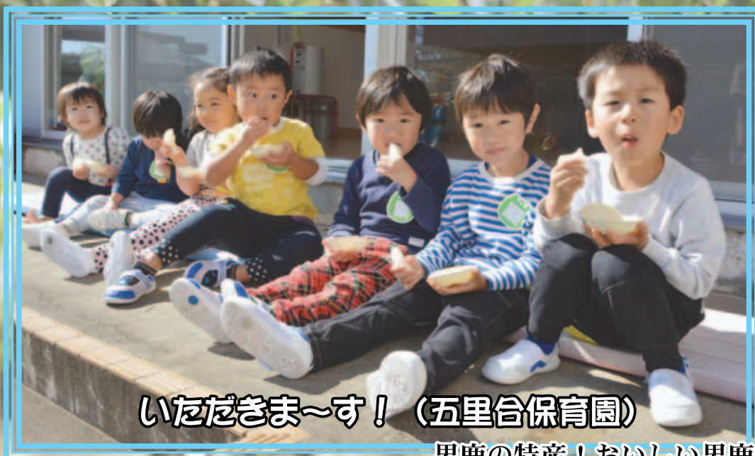
いただきます～す！（五里合保育園）