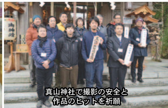
真山神社で撮影の安全と 作品のヒットを祈願