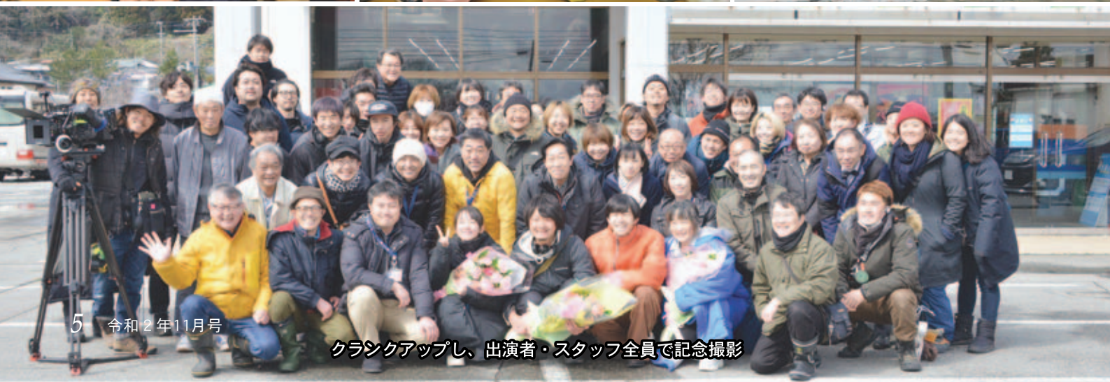
クラシックアップし、出演者・スタッフ全員で記念撮影