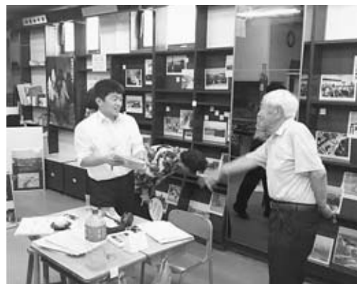
▲平成30年7月に開催した 「ふなかわなつかし写真展：対比」

協力隊の任期はこれで終わりますが、 今後も男鹿市内に残り市内の企業に勤 務します。何も知らない私に、さまざま なことを教えてくださる地域の皆さん に心より感謝しています。