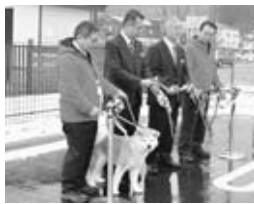
▲秋田犬ふれあい処 in 道の駅おがオープン！

命名式後には、「秋田犬ふれあい処 in 道の駅おが」でオープニングセレモニーが行われ、初めて公の場に登場した「つばき」は、元気にふれあい処を駆け回っていました。