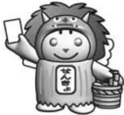
なまはげめいすいくん