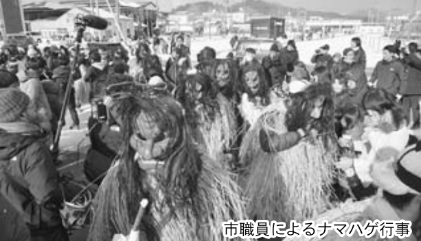
市職員によるナマハゲ行事

また、DMO事業ではナマハゲ行事を体験するツアーが実施され、4地区に17名の方が参加し、男鹿の大晦日を堪能していました。