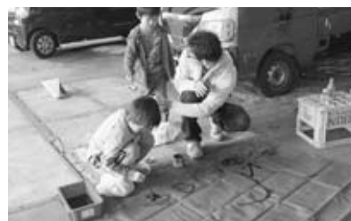
▲平成28年12月に開催した 「あんてぱんだん・おが」

展示会場を選ぶ際には地元 の 旧鉄工 所、文房具店にお世話になりました。 この2つの会場には、昔の名残を感じ るといふ共通項が存在しています。展 示物と空間に名残を感じ、建物の印象 をより素敵なものに感じさせる機能を 持たせたい と考えまし た。これは、 ドラマのロ ケ地に思い をはせる気 持ちに似て いるかもし れません。