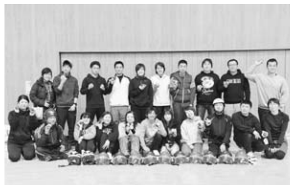
▲平成30年2月に開催した「雪合戦体験会」の集合写真 （本人・前列右から2人目）

男鹿に来てまだ3年。知らないこと、 できないことだらけです。これからも、 ご指導をよろしく願っています。