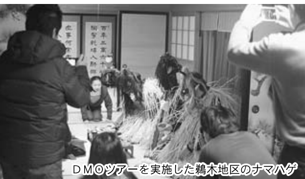
DMOツアーを実施した鶴木地区のナマハゲ