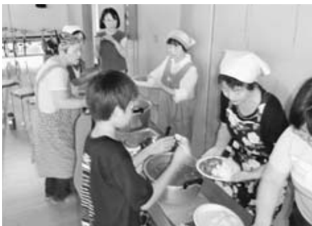
▲むつみ会の方々による炊き出し（防災教室より）