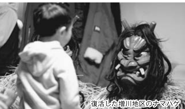
復活した増川地区のナマハゲ