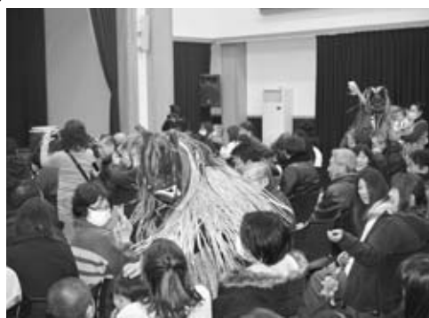
▲五風内へ乱入するナマハゲ