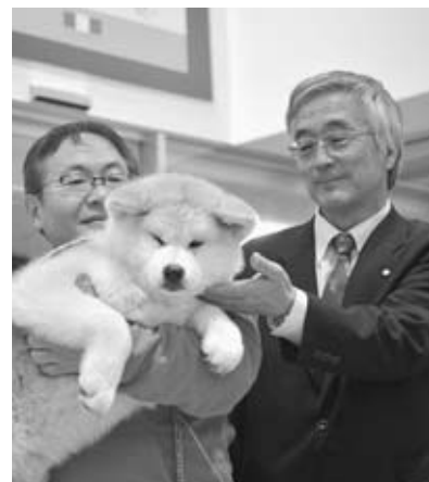
▲オガーレに新しく仲間入りした秋田犬「つばき」をなでる菅原市長