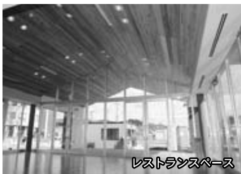
レストランスペース

レストランは40席しかないので 貸し切りバスのお客さんは、基本的には市内の団体客が入れるお店に案内します。 すでに7月1日の予約をいただきましたが、市内の別のお店を紹介しました。