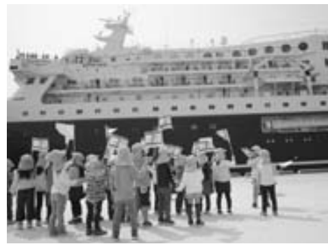
▲歓迎小旗を体いっぱいにする保育園児