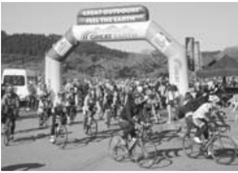
▲快晴の中、一斉にスタートする参加者

5月20日、北浦のなまはげオートキャンプ場を発着点として、第4回あきた白神・男鹿なまはげライドが行われました。18日の大雨により、コースが一部変更となりましたが、世界自然遺産の白神山地がある八峰町までの往復(最長186キロ)などをコースに、全国から約400名が参加し、男鹿の絶景などを楽しみながら軽快に駆け抜けていきました。コース途中では、「ハタハタとタイの握り寿司」などが提供され、参加者は男鹿の食も堪能していました。