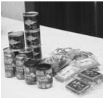
▲新たな特産品として発案された新商品の数々