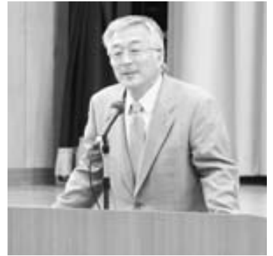
▲入学式で式辞を述べる菅原市長