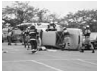
▶昨年の防災訓練から

当日は、10時10分より全市一斉に大津波警報のサイレンを吹鳴しますのをお知らせいたします。