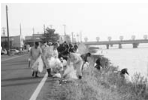
▲たくさんの皆さんが参加し、ごみを拾い集めました