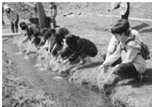
▲サケの稚魚を一斉に放流する児童たち

4月12日、北陽小学校の5年生10人が、北浦・野村川へサケの稚魚約2万尾を放流しました。 放流体験は、少年水産教室として小学校児童を対象に、サケの生態と漁業の関わりを学んでもらうため、県水産振興センターの協力のもと実施しています。 放流したのは、同センターが採卵し、全長約6センチにふ化させた稚魚で、児童たちは「大きくなって」と声をかけながら一斉に放流し、勢いよく泳いで行く稚魚を見送りました。