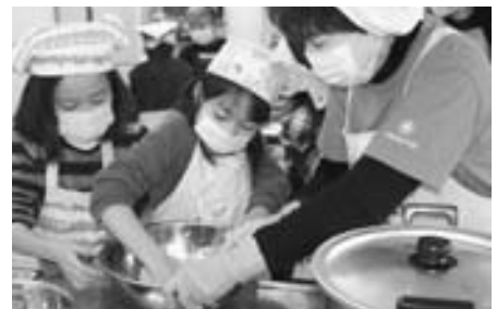
おやこ郷土料理調理体験では、きりたんぼ風の「あんぶらもち」を作り、好評でした。