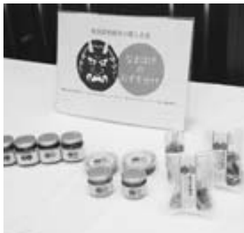
▲「なまはげのおすそ分け」としてつくられた統一パッケージ