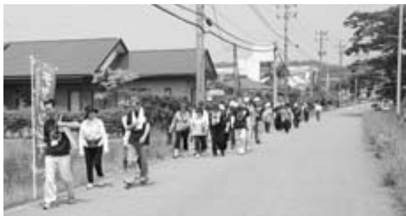
▲昨年のなまはげ健康ウォーキング

※15分以上運動などをした人は、折り込みチラシを ご覧いただき実行委員会まで報告してください。 QRコードも利用できます。