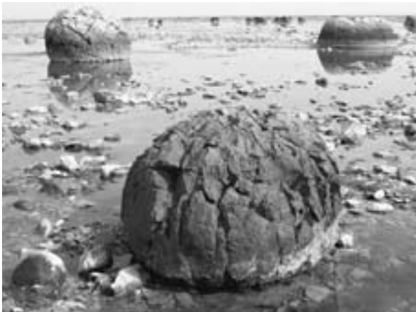
▲問い合わせ／ジオパーク推進班 渡部 ☎24-9104

当ジオパークを代表するジオサイトである鶴ノ崎海岸で、大地の物語を感じてみませんか？