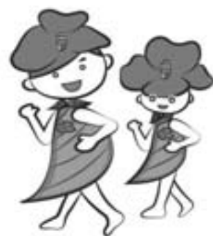
男鹿市健康づくりマスコットキャラクター つばき王子&つばきひめ