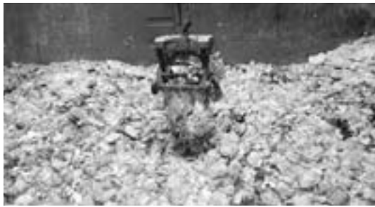
▲燃えるごみが集められる「ごみピット」