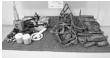
金属板、鉄パイプ、スプレー缶、ビン、電池、蛍光灯など