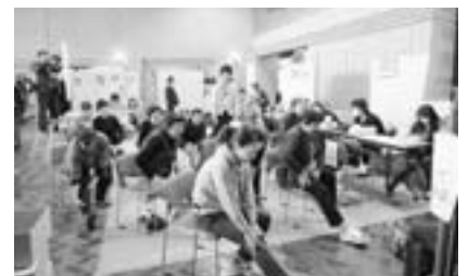
（昨年の健康フェスタの様子）