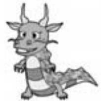
八郎湖水質保全 シンボルキャラクター 「清龍くん」