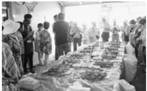
▲問い合わせ・申込み／男鹿総合観光案内所 ☎35-5300