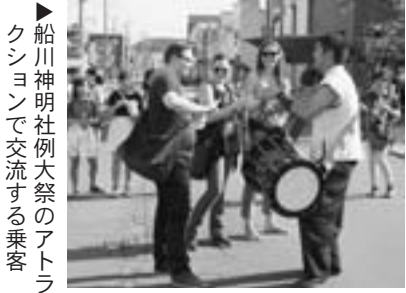
▲船川神明社例大祭のアトラクションで交流する乗客