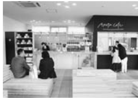
▲リニューアルオープンした男鹿総合観光案内所

平成19年6月にオープンし、年間約10万人が利用する当施設も開館から10年を迎え、市民や観光客から要望の高かった男鹿の土産や特産品の充実に加え、本格焙煎コーヒー店の出店により休憩コーナーのくつろぎ空間が広がりました。今後も市民の皆さんに親しまれ、利用していただける施設を目指していきます。