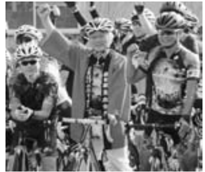
▲男鹿半島なまはげライドの出発前に 気合いを入れる菅原市長