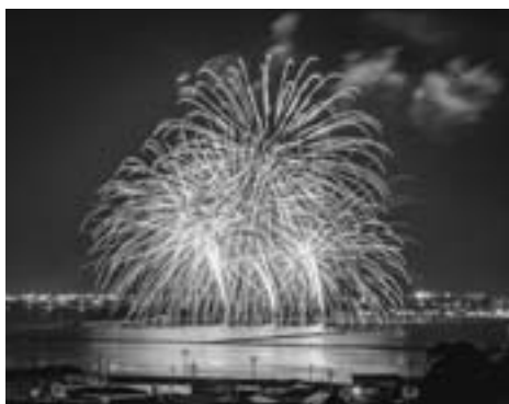
▲昨年度の男鹿日本海花火フォトコンテスト金賞作品