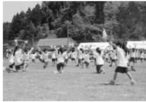
▲脇一小伝統の「脇一の花」を披露する全校児童

5月13日の船川第一小、潟西中を皮切りに、5月28日までに市内全小・中学校で運動会が行われました。