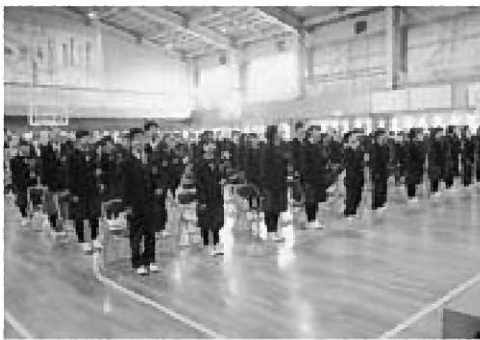
▲卒業証書を受け取り、校歌を歌う卒業生