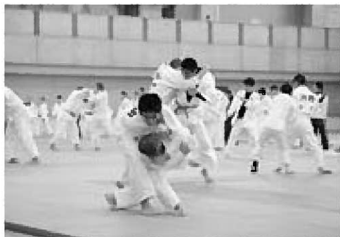
▲仲間とともに汗を流しながら技を磨く参加者たち