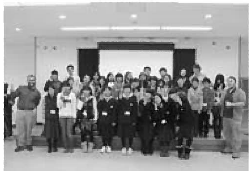
▲参加した児童生徒らと留学生の皆さん

1月8日、市内の小中学生が秋田市雄和にある国際教養大学を訪問し、同大の留学生らと交流しました。参加したのは小学生12名と中学生8名で、はじめに大学側から説明を受けた後、施設見学を行いました。見学では、蔵書の7割を洋書が占める図書館や多目的ホール、講義棟などを興味深そうにながめていました。児童生徒は、グループごとに分かれて留学生と英語での自己紹介やフリートークを楽しむなど、交流を深めていました。