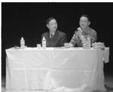
▲城跡の面白さを語る出演者（左・千田氏、右・春風亭昇太氏）

奈良大学学長で城郭考古学を専門とされている千田嘉博氏、芸能界屈指の山城愛好家として知られる落語家の春風亭昇太氏、城に関連する多数の著書を執筆されている城郭ライター の 萩原さちこ氏の3氏を出演者として迎え、