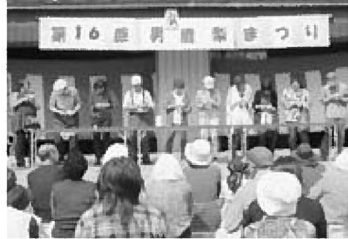
▲梨の皮をむく参加者の皆さん

男鹿梨まつりが9月27日、J A 秋田みなみ中石梨選果場を会場に行われました。 毎年梨の収穫時期に合わせて開催されている祭りでは、梨狩り体験や歌謡ショー、大抽選会などの催し物が行われたほか、梨の皮むき競争では、優勝者が大会新記録となる190秒を記録しました。 愛知県春日井市の給食にも使用されている男鹿梨ですが、会場では梨の販売のほか梨のタルトや梨のコンポートなどの加工品も販売されました。