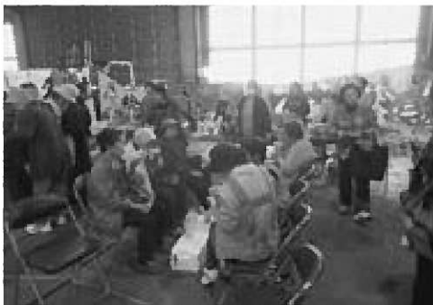
▲たくさんの人でにぎわったミニ漁業祭

たくさんのお客さんで賑わった会場では、さけ汁約200食が振る舞われるなど、地域の方々が買い物に訪れ、完売する商品が出るほどの盛況ぶりでした。