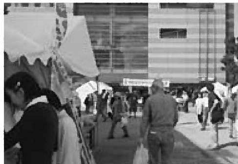
▲たくさんの人でにぎわった全国ふるさとまつり

10月3日・4日、神奈川県大和市で「第6回 全国ふるさとまつり うまいもの市」が開催されました。大和市と全国の自治体や大和市在住の各県人会などが特産品を持ち寄り、大和市と交流を深め地域を活性化させることを目的に開催されているもので、男鹿市は今年が初参加となりました。過去最大の31団体が参加したまつりでは、男鹿市の特産品が販売され男鹿梨が完売するなど好評だったほか、ナマハゲの練り歩きなどによる観光PRが行われました。