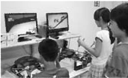
▲バーチャル手術体験をする参加者の皆さん

医学部訪問は、将来の職業として医師を目指 す子どもや、医療関係の仕事に興味・関心があ る子どもが、具体的な目標を持って努力できる よう昨年から実施しています。