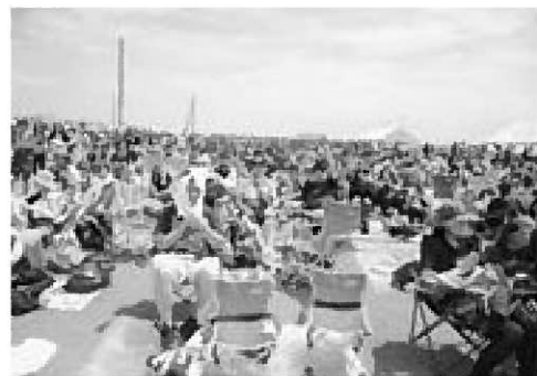
▲会場を埋め尽くす観客

7月25日と26日の2日間、男鹿ナマハゲロックフェスティバルVOLUME 6が、船川港内の特設会場で行われました。 「音楽を通して地元を活性化したい」という思いから平成19年に市民文化会館で初めて開催され、今回で10回目を迎えたこのイベントは、回を重ねるごとに規模を拡大し、全国的な知名度も高くなってきています。若い世代に人気のアーティストが多数出演し、両日とも県内外から多くの観客が男鹿を訪れました。