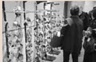
▲ボランティアの皆さんが作った古布細工