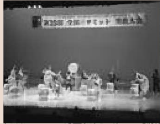
▼男鹿海洋高校なまはげ太鼓部によるパフォーマンス