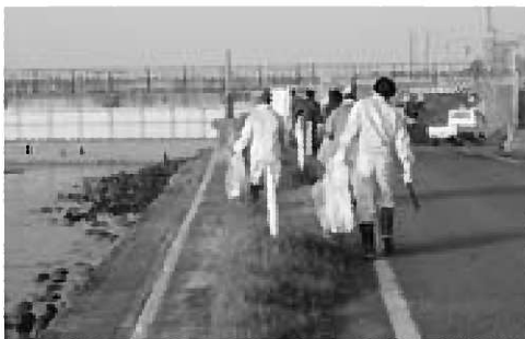
▲たくさんの皆さんが参加してごみを拾い集めました

本格的な観光シーズンを前に市内を清掃し、市民の環境美化と保全に対する意識の高揚を図るため、4月19日、全市一斉清掃・八郎湖クリーンアップが行われました。