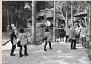
▶快晴の中、市内各地を巡る12日の現地視察