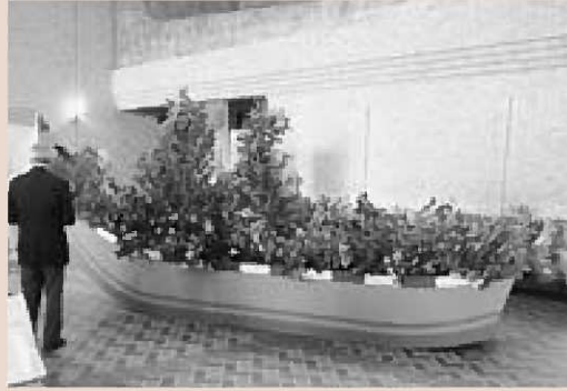
▲エントランスホールにて参加者を出迎えた北前船椿オブジェ