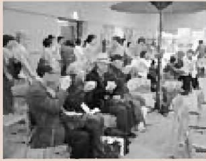
▲好評だった男鹿市茶道連盟による茶席コーナー