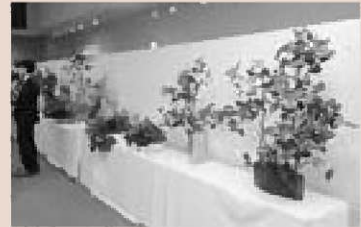
▲生け花や絵画などの展示ブース