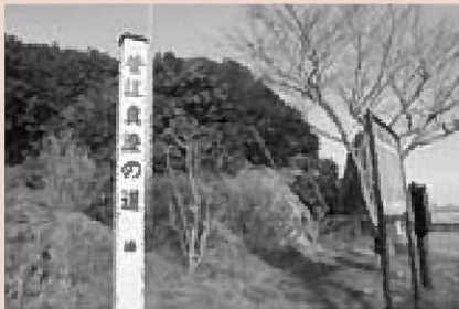
▲国の天然記念物に指定されている椿自生北限地帯（能登山の椿）