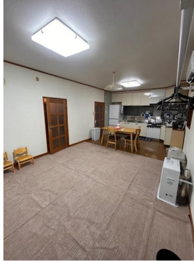
リビング（反対側から）