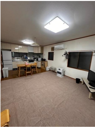
リビング（玄関側から）