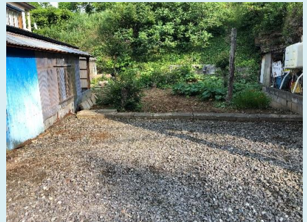
↑ 余裕のある駐車スペース (写真手前) 家庭菜園が楽しめる土地 (写真奥)